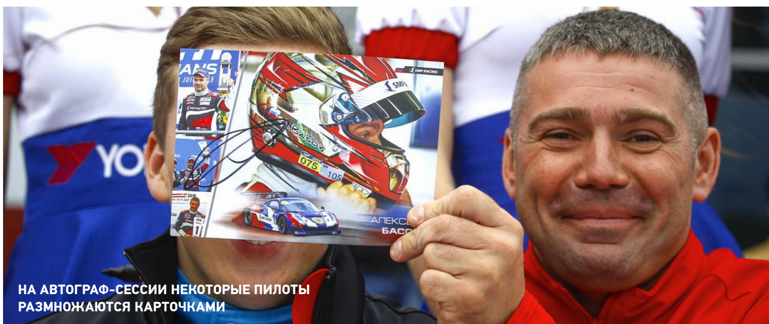
НА АВТОГРАФ-СЕССИИ НЕКОТОРЫЕ ПИЛОТЫ РАЗМНОЖАЮТСЯ КАРТОЧКАМИ