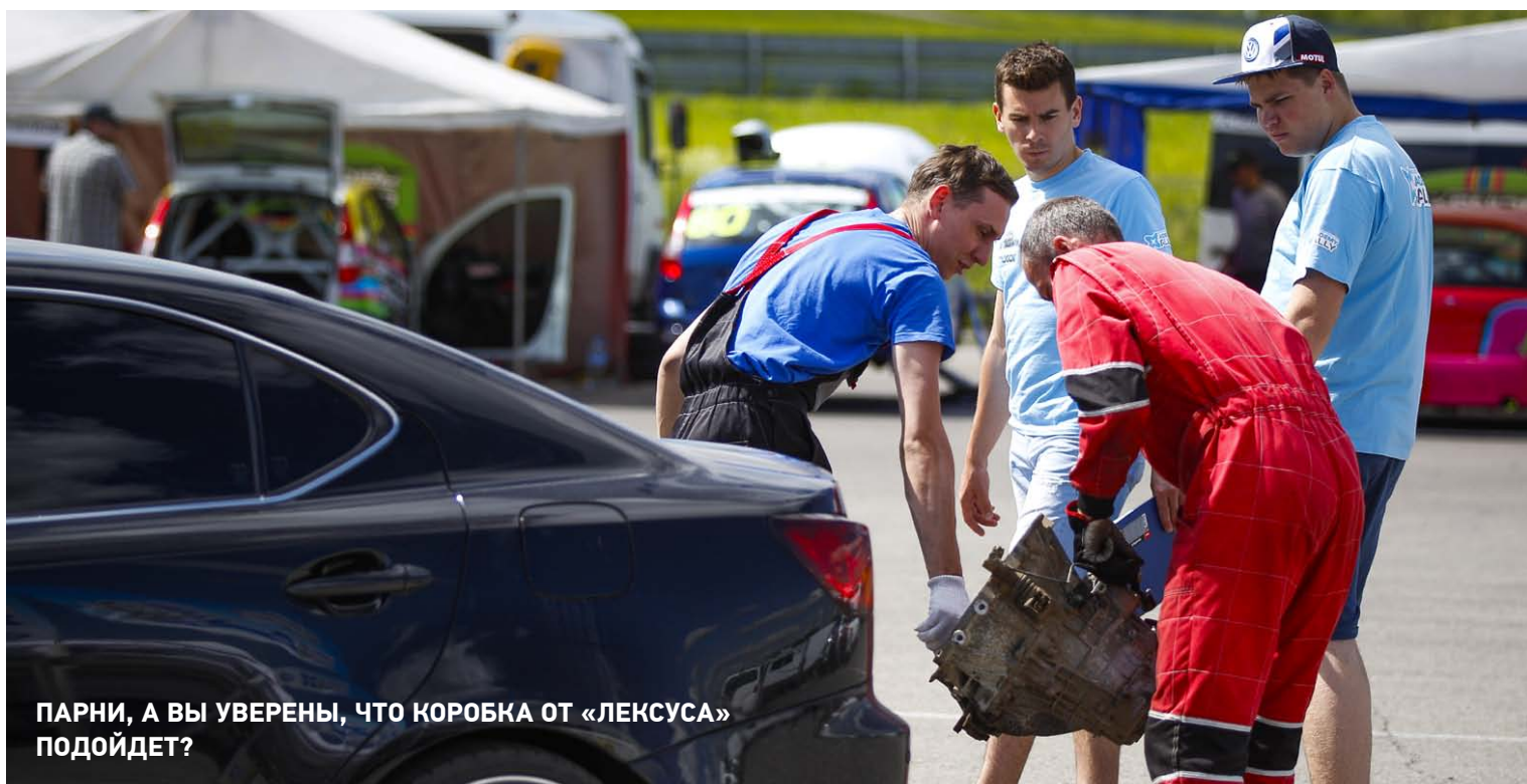
ПАРНИ, А ВЫ УВЕРЕНЫ, ЧТО КОРОБКА ОТ «ЛЕКСУСА» ПОДОЙДЕТ?